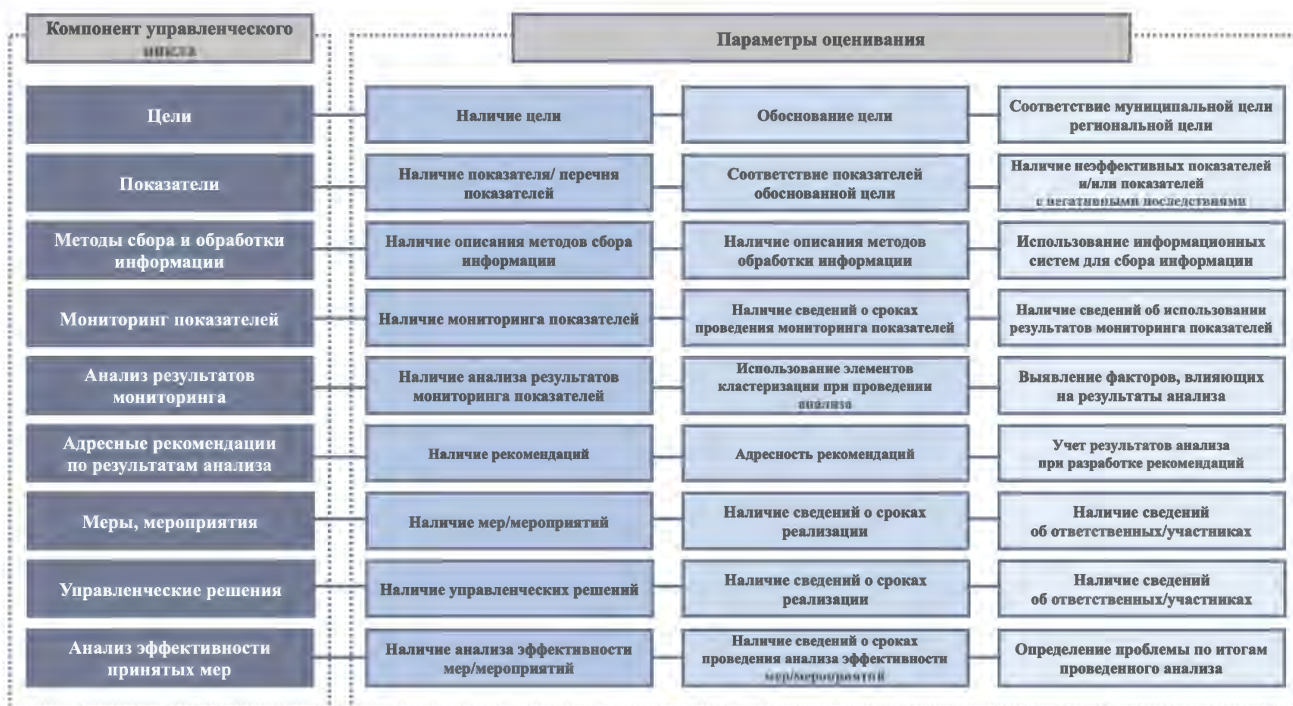
Рисунок 2 – Параметры оценивания позиций оценивания, характеризующих компоненты управленческого цикла

Каждая позиция оценивания внутри каждого компонента управленческого цикла оценивается по трем параметрам. Параметры оценивания компонентов управленческого цикла представлены на рисунке 2.