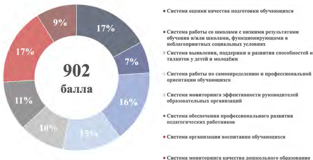
Рисунок 3 – Структура итогового балла

Максимальный итоговый балл по результатам проведения Оценки составляет 902. Структура итогового балла представлена на рисунке 3. Максимальные баллы по направлениям представлены в таблице 1.